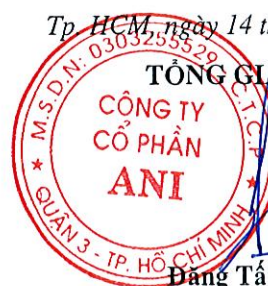
Đặng Tất Thành